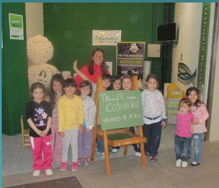
Paseo del Fuego Nov. 2011